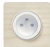
Prise de courant Odace Touch

Optez pour des couleurs claires pour apporter plus de luminosité et laisser à l'œil la possibilité de se perdre.