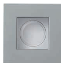
Variateur de lumière Unica Pure

• Des prises électriques en quantité suffisante et une prise USB pour recharger son téléphone.