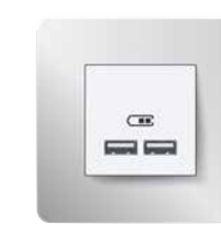
Double prise USB Unica Studio Métal