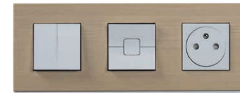
Double interrupteur + ?? + prise Unica Pure