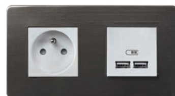
Prise + double prise USB Unica Studio Métal

Optez pour des couleurs claires pour apporter plus de luminosité et laisser à l'œil la possibilité de se perdre.