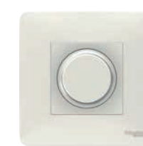
Variateur de lumière Unica Studio

• Pour bénéficier des technologies avec souplesse et efficacité, prévoir en amont l'ensemble des besoins. Le plan de l'installation électrique, le nombre de prises et leur emplacement sont primordiaux afin de ne pas se retrouver avec des fils traînant dans la poussière et créant un inconfort visuel et fonctionnel.