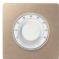
Thermostat Odace Touch

• Priorité n°1 : l'isolation du toit afin d'éviter les déperditions de chaleur. Installez également un thermostat pour gérer efficacement vos consommations d'énergie.